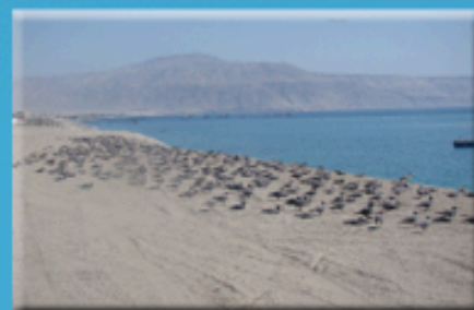
Garumas en Mirador Puerto Angamos