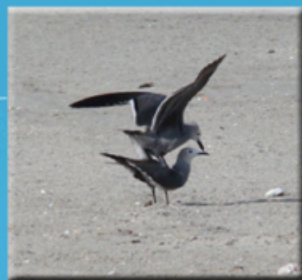
Pareja en cortejo