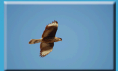
Adulto en vuelo

Reproducción: Construye un nido de palitos sobre árboles altos o en acantilados. Pone dos o tres huevos de color cremoso rosados manchados de rojizo. La incubación es de 28 días.