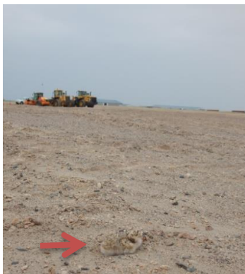
Pollo en proyecto Kelar

Entre el 21 y 22 de octubre se realizó la última campaña de prospección en la Región de Tarapaca, monitoreo que se realiza desde el año 2010 en conjunto con le SAG de dicha región. El total de nidos registrados en la región son: El Loa 69 nidos, Ike-ike 20 nidos, Aeropuerto 5 nidos, Patillo 5 nidos, Yape 4 nidos, Quinteros 3 nidos y Chanavayita 2 nidos. Este año destaca el sector de Ike Ike, donde se registra cada vez más actividad de reproducción. Recordamos que el año pasado en este lugar se registró la bandada más grande observada en esa temporada (600 individuos).