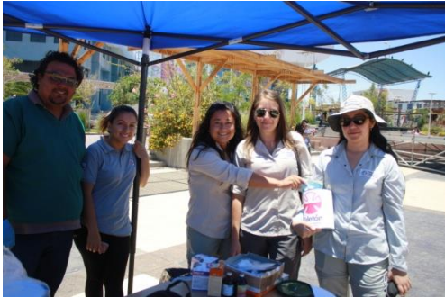
Operativo veterinario solidario

Campaña de recolección fondos para la Teletón 2014: esta iniciativa surge con la finalidad de colaborar en dinero con la Fundación Teletón y al mismo tiempo incentivar y motivar a la comunidad de Mejillones en el cuidado de sus mascotas. Se atendieron a 20 pacientes aproximadamente y se recolectaron $80.000 pesos, los que fueron depositados a la cuenta de la Teletón. La actividad fue organizada por el Canil Municipal y la Fundación Gaviotín.