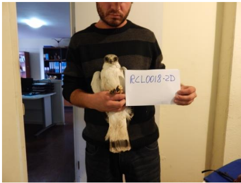
Último aguilucho capturado en Pampa Mejillones.

Plan de Control y Manejo de Aves Rapaces: en el mes de octubre y noviembre se realizaron las dos últimas campañas de este año (5º y 6º). En resumen, se capturaron y relocalizaron 8 ejemplares de traros y 3 ejemplares de aguilucho. Uno de estos últimos ejemplares liberado en la cordillera de la región del Maule, volvió a Pampa Mejillones, recorriendo aprox. 1.800 km de regreso. Por esta razón, el último ejemplar capturado se encuentra en cautiverio hasta finalizar la temporada de nidificación.