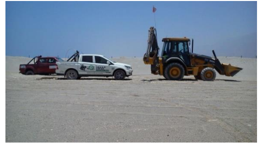
Vehículos en área de nidificación enterrados, teniendo que ser retirados con maquinaria.

Patrullaje y control vehicular: Lamentablemente, y a pesar de los constantes monitoreos de los guardafaunas, hemos tenido una gran cantidad de intromisión a las áreas de nidificación y crianza. Al momento se han registrado 11 vehículos en zonas críticas de nidificación. Esta perturbación, ha puesto en riesgo las nidadas y polluelos, especialmente en el sector aledaño al proyecto Kelar.