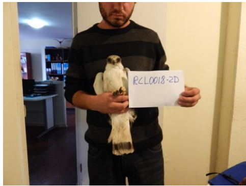
Último aguilucho capturado en Pampa Mejillones.

Plan de Control y Manejo de Aves Rapaces: en el mes de octubre y noviembre se realizaron las dos últimas campañas de este año (5º y 6º). En resumen, se capturaron y relocalizaron 8 ejemplares de traros y 3 ejemplares de aguilucho. Uno de estos últimos ejemplares liberado en la cordillera de la región del Maule, volvió a Pampa Mejillones, recorriendo aprox. 1.800 km de regreso. Por esta razón, el último ejemplar capturado se encuentra en cautiverio hasta finalizar la temporada de nidificación.