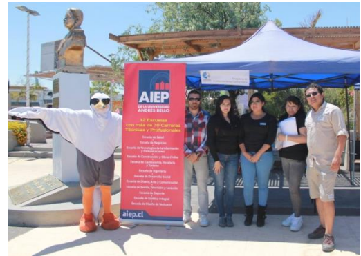
Equipo de trabajo del “programa de involucramiento Comunitario”

Programa de involucramiento comunitario: a partir del próximo año Fundación implementará este programa de Involucramiento Comunitario, el cual tiene por objetivo acercarse a la comunidad de Mejillones y disminuir las brechas que existen con respecto a la participación, el cuidado de la especie y la labor institucional. Este trabajo es parte del proyecto de título de alumnos del instituto profesional AIEP de la carrera de Asistente Social.