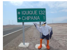
En camino a visitar a sus primos Iquiqueños

En el mes de octubre, nuestro amigo “Fermín el Gaviotín” fue invitado por la Secretaría Regional Ministerial de Medio Ambiente de la Región de Tarapacá y el Servicio Agrícola Ganadero a participar de la Campaña de educación y difusión que estas instituciones realizan para sensibilizar a la comunidad de región Tarapacá.