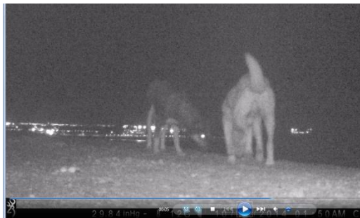
Perros tratando de depredar huevos electrificados