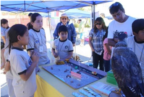
Stand de protección y manejo, atendido por alumnos