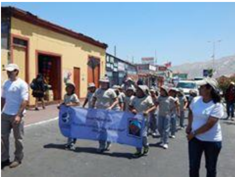
Desfile Cívico Comunal de Mejillones, 8 de octubre

Taller de Gaviotín chico en Antofagasta: el 15 de octubre se realizó en el Museo Mirador la Portada un taller a los alumnos de la escuela D-73 de la comuna de Antofagasta. Esta actividad se realiza en el marco del convenio de colaboración entre CONAF y Fundación que pretende difundir la conservación de la especie.